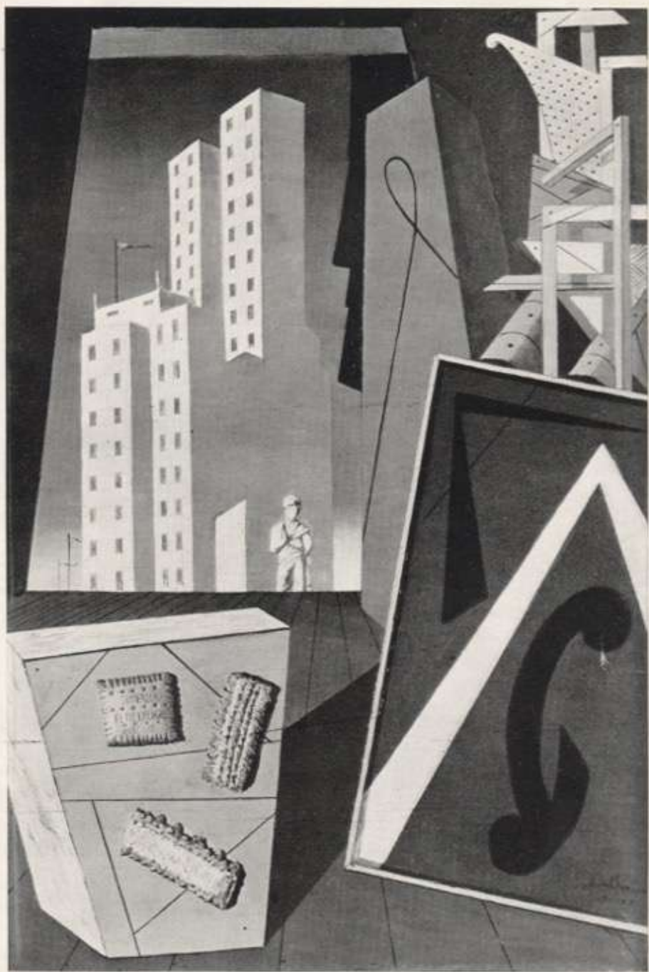
Natura morta evangelica. 1917.