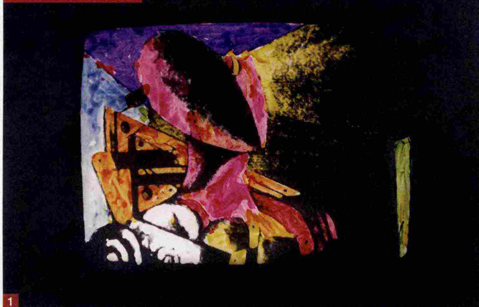
1 Mario Schifano, Maestro italiano del '900 , 1976, smalto su tela emulsionata e plexiglas. 2 Giorgio de Chirico, Poesia d'estate , 1970, olio su tela. 3 Giulio Paolini, La caduta nel mondo , 2009, collage su carta. 4 Mario Ceroli, I mobili nella valle , 1965, legno.