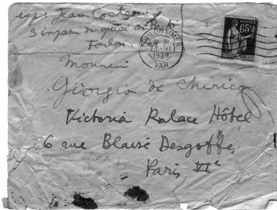
fig. 4 Timbro: Toulon s/mer Var - 21:30 23 giugno 1938

esp: Jean Cocteau 3 impasse du quai du Parti Toulon Var