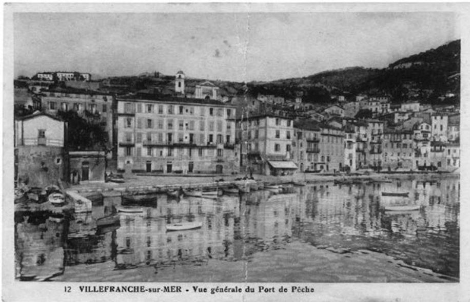
fig. 3 Cartolina postale Illustrazione: Villefranche-sur-mer Vue générale du Port de Pêche