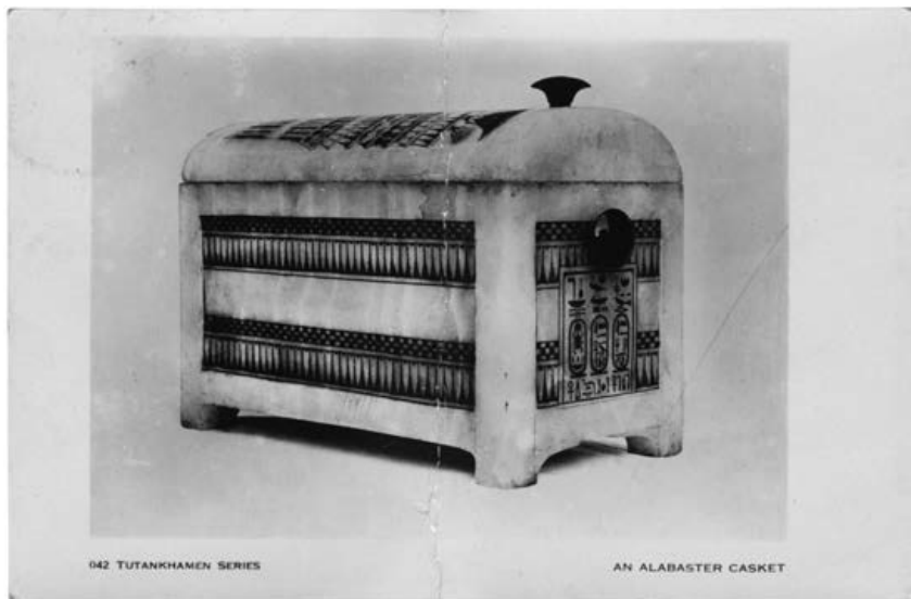
fig. 1 Cartolina postale Illustrazione: Tutankhamen series – an alabaster casket